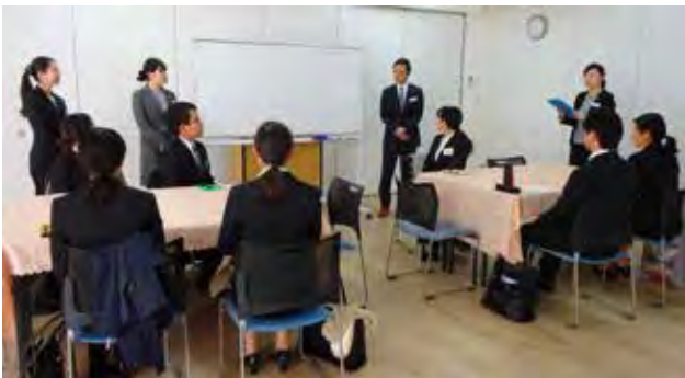
「自分の強みを見つける」をテーマに グループワークを行いました

ロングライフ阿倍野（大阪市阿倍野区文の里 2-1-19） ロングライフ福祉専門学院（大阪市北区堂山町 1-5 三共梅田ビル 6F） ロングライフ阿倍野 ロングライフ福祉専門学院